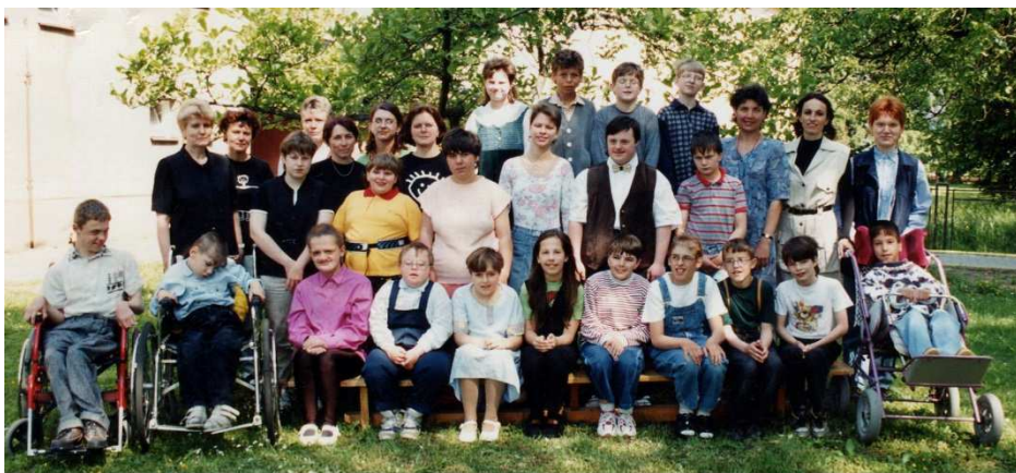
Školní rok 1998-99